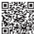
President Lennart Meri kõne (2001)

6.3. Töö tekstiga. President saab oma sõnumit ühiskonnale edastada kõne kaudu. Kõnes võib ta esitada vaateid ja täheldusi või juhtida tähelepanu mõttekohtadele ja eetilistele valikutele. Hea kõne sisaldab ettepanekuid ja sõnastab ühiskondlikud eesmärgid. Loe president Lennart Meri 2001. aastal peetud kõnet kooliaasta alguse puhul ja president Alar Karise kõnet 2023. aasta tublidele koolilõpetajatele.