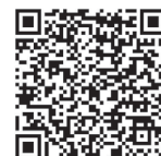
President Alar Karise kõne (2023)