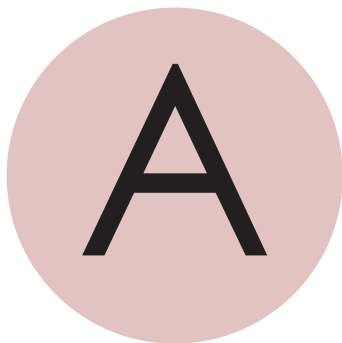
See on A.

Kalluta pea vasakule viltu. Kuidas aleph nüüd paistab?