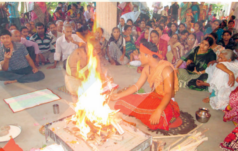
Puudža rituaal tänapäeva Indias

Varased aarialased olid rändkarjakasvatajad, ent Indias hakkasid nad tegema põlluharimisega ning rajasid oma esimesed kuningriigid. Nad austasid paljusid jumalaid, kes tihti esindasid loodusjõude, näiteks peajumal Indra oli taeva- ja piksejumal, Varuna ookeani-, Agni tule- ja Sūrya päikesejumal. Olulisem sellest, kes need jumalad olid, on hilisema hinduismi jaoks aga see, kuidas inimesed neid austasid ja nendega suhtlesid.