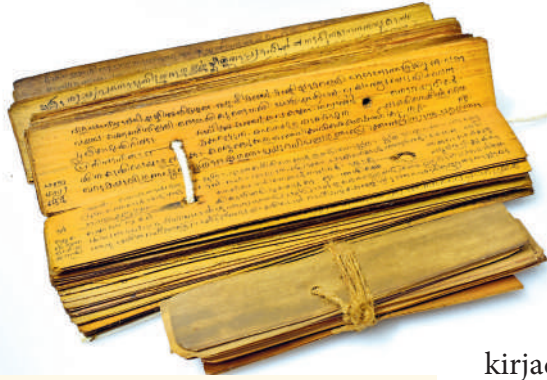
Sanskritikeelne veeda tekst palmilehel

Hinduism on üks maailma suuremaid religioone, millel on järgijaid üle miljardi. Neist suurem osa elab Lõuna-Aasias, aga hinduism ei ole enam ammu vaid kindla piirkonnaga seotud religioon. Samas on hinduismi mõneti raske pidada üheks religiooniks, kuivõrd tema sees on palju erinevaid kombeid, uskumusi ja õpetusi. Siiski on neil kõigil olemas teatavad ühisjooned. Nendeks on hindu identiteet, olulised festivalid, sanskritikeelne kirjandus koos Veedade -nimeliste püha-kirjadega ning mõned olulisemad õpetused.