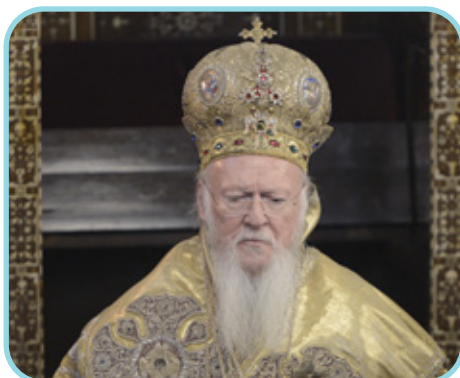
Kreekakatoliku ehk õigeusu kirik