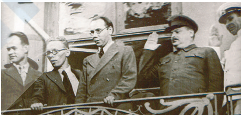
Ždanov ja Nõukogude käsilased Nõukogude saatkonna rõdul Tallinnas 24. juulil 1940. aastal. Vasakult paremale: Neeme Ruus, Johannes Lauristin, Karl Säre ja Andrei Ždanov.

Reedel, 21. juunil , neli päeva pärast Punaarmee sissetungi, korraldati NSV Liidu saatkonna ja kohalike Nõukogude käsilaste juhtimisel Tallinnas ja veel mõnes linnas meelevaldused, kus nõuti uue valitsuse ametissenimetamist. 19. juunil oli Tallinna saabunud Stalini eriesindaja Andrei Ždanov , kes dikteeris president Pätsile uue „rahvavalitsuse“ koosseisu. Valitsus astus ametisse 21. juuni õhtul. Nukuvalitsuse peaministriks sai arst ja pahempoolne literaat Johannes Vares , kirjanikunimega Barbarus. Riigi ja ühiskonna tähtsad sektorid (politsei, sõjavägi, side- ja massikommunikatsiooni-vahendid) olid kohe pärast okupatsiooni kommunistide ja NSV Liidu esindajate kontrolli alla võetud.