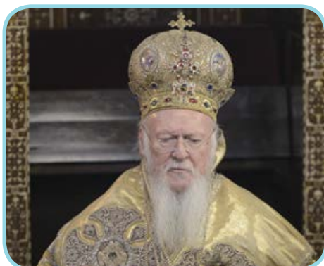
Kreekakatoliku ehk õigeusu kirik