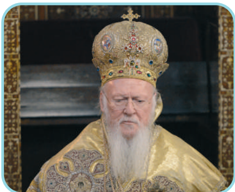
Kreekakatoliku ehk õigeusu kirik